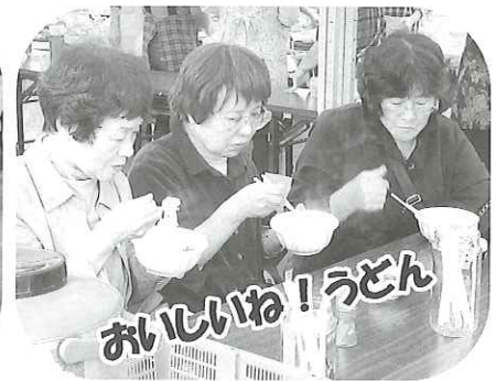
おいしいね!うどん