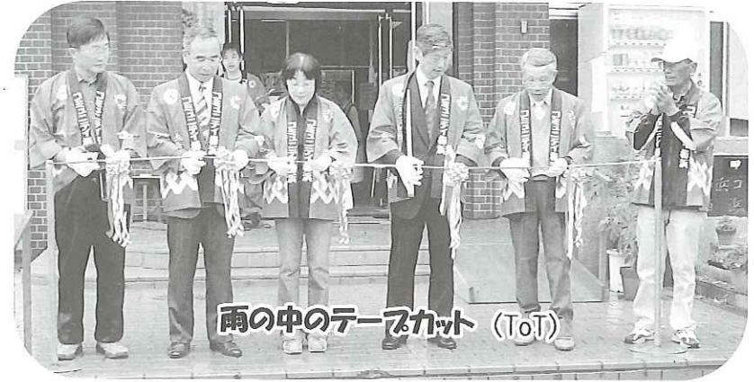
雨の中のテープカット (ToT)