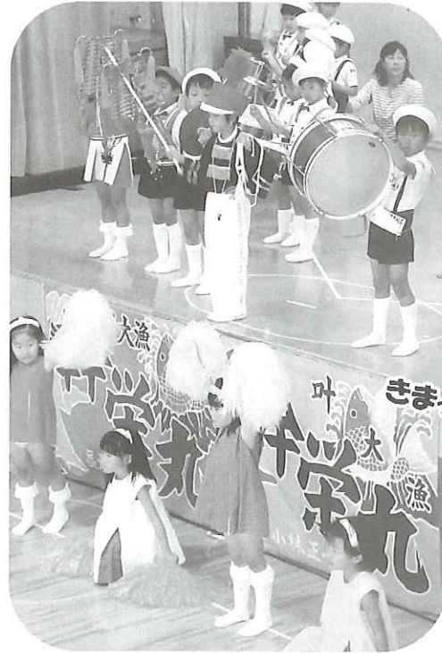
蓮生まこと幼稚園