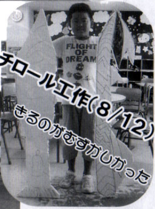
発泡スチロール工作(8/12)