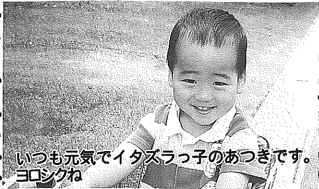
いつも元気でイタズラっ子のおつぎです。 ヨロシクね