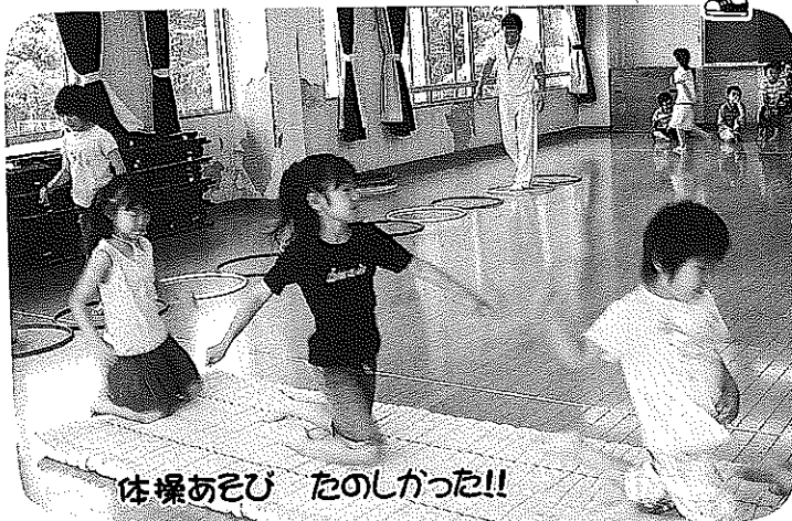
体操あそび たのしかった!!

住みよいまちってどんなまち⑦ 地区の住民を対象にいろいろな催しが行われています。参加者数は天候にも影響されますが、コミュニティ推進協議会が5月に実施したサイクリング大会と千潟フェスティバルはどちらも100名を超す参加者のもと無事終了しました。参加した人がお互いの顔を覚え、あいさつを交わしあいコミュニケーションが深まっていくことを期待しています。 7月には地区一斉清掃が行われます。地区内を見回してください。汚いところや危険なところはないですか。目的意識を持って作業に参加しましょう。 レジャーの多様化、人口構成、価値観の相違で地区行事への参加は減少傾向にありますが、地区内のつながりをつくっていくことは、防犯・防災面でも必要なことだと思います。 今後予定されている納涼大会や文化祭、運動会などの行事は多くの人の参加と協力がなければ実施できません。 行事を盛り上げるため知恵を出し合いましょう。