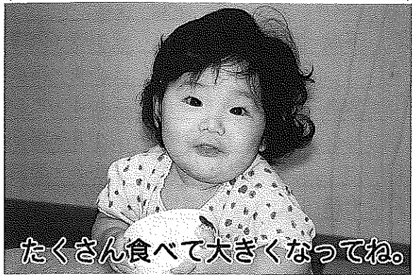
たくさん食べて大きくなってね。