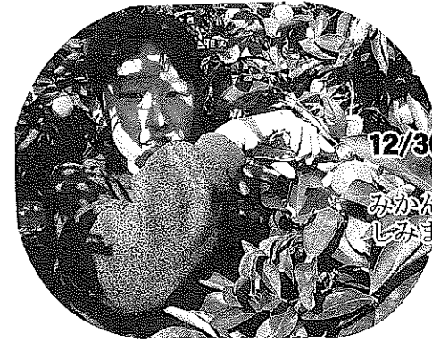
12/3(土)親子みかん狩り(ぶらんこ) 参加者 50名 みかんのつかみ取りやビンゴなどをして楽しめました。