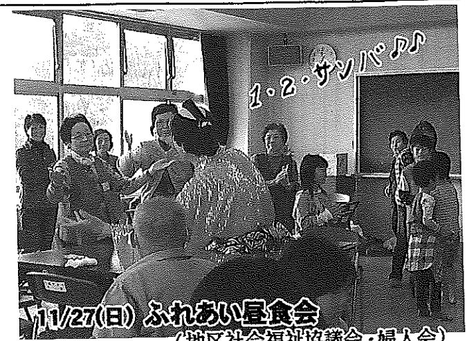
11/27(日) ふれあい昼食会 (地区社会福祉協議会・婦人会) 元気な子ども達とマツケンサンバで盛り上がり、楽しい時を過ごしました。