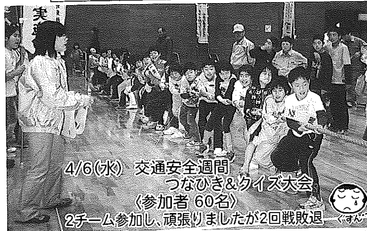
4/6(水) 交通安全週間 つなひき&クイズ大会 (参加者60名) 2チーム参加し、頑張りましたが2回戦敗退

<スポ少野球> 4/9 西京銀行杯周南市少年野球学童部大会 榑浜 1:2 沼城 「逆転サヨナラで負けた。しかも1回戦、今日は守備はよかったが、バッティングがいまいち。でもみんながんばった。それで負けたからすごく嬉しい。次にこれをいかしたい。」 清木 満憲(中町)