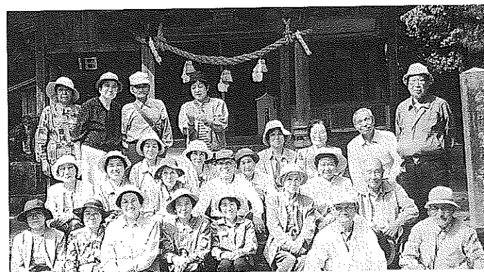
徳地町島地にある出雲神社でパチリ!