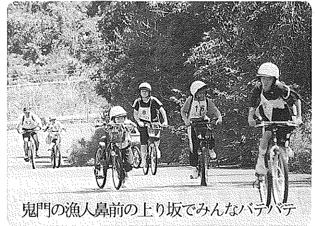
鬼門の漁人鼻前の上り坂でみんなバテバテ