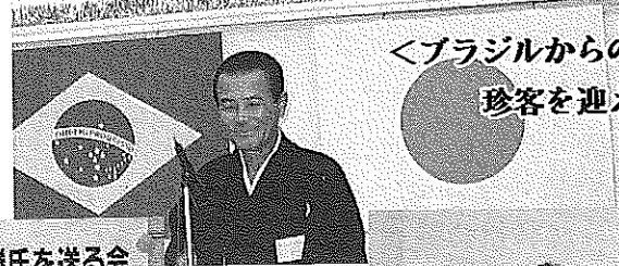
＜ブラジルからの 珍客を迎えて＞