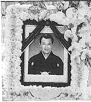
6月3日 13時 しめやかに合同葬