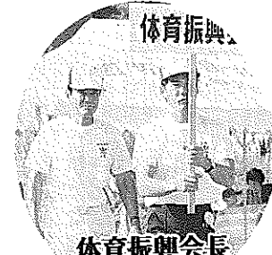
体育振興 体育振興会長 ＜地区運動会で＞