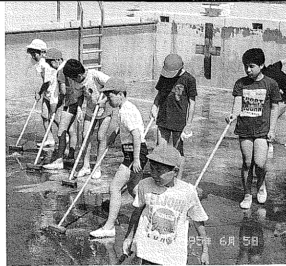
6/5 榑浜小学校プール清掃 “水のシーズン”到来!小学校ではプール開きに備えて、プールの清掃を実施しました。