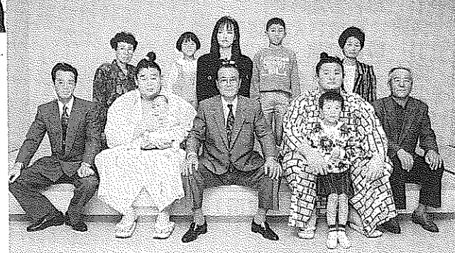
大相撲徳山場所 若・貴と