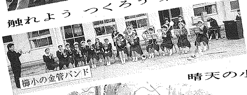
榑小の金管バンド