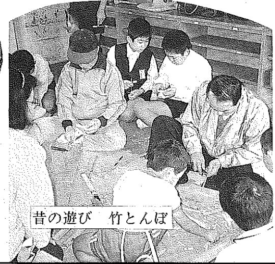
昔の遊び 竹とんぼ