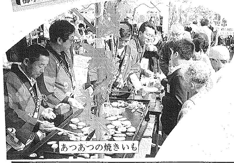
あつあつの焼きいも