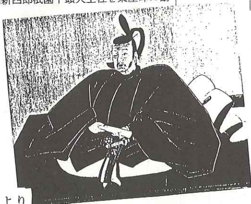
「ふるさと櫛浜」より

お出かけの時は是非地元駅の「櫛浜」を利用してほしい。そして鉄道のすばらしさを味わって下さいませは、お電話を。早い時期でも受け承ります。