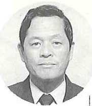
櫛浜駅の駅長さん

「やあ今日は、白い歯をのぞかせニコニコ顔、親しみやすい人柄。まあまあどうも。」 現在櫛浜駅は三人で一人勤務の状態で、その上周辺の駅に「お客さまに親しみ・愛される駅づくり」をかかげ、掃除やあいさつに心がけ、気持ちの良い駅にしたいと意欲満々。 趣味もプロ並みで、こだま山岳会をつくり、計画からお世話までされており、日本中の山に出かけ自然観察を楽しんでおられる。また、釣り、アマチュア無線等々何でもチャレンジ、ファイトのある方、人を知り、出合いを大切に、を信条にしておられる。地域の行事にも進んで参加したいといううれしい言葉。 ちょっとPRを！