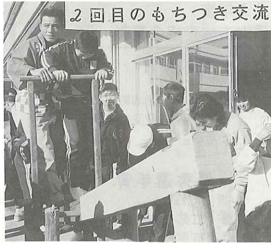
2回目のもちつき交流

国立公園太華山登山道や水路をずっと清掃してきた小踏愛山会(メンバー16人)が、1月19日、田布施養護学校徳山分校を訪れ、生徒や父母といっしょに、もちつきをして交流した。昨年に続いて2回目、地域と学校の交流を深めようと始まったものです。