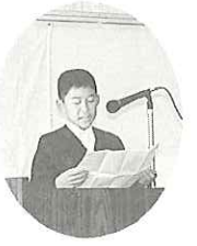
建国記念の日によせて