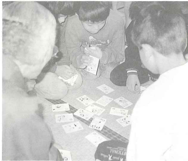
1月7日 児童館が主催して、カルタ取りや福笑いなどで一日楽しく遊びました。