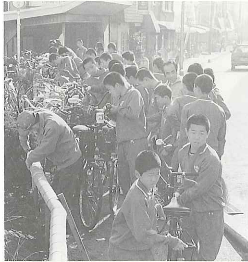
12月21日 太華中学校の生徒が駅前と自転車置場の整理整頓に汗を流しました。