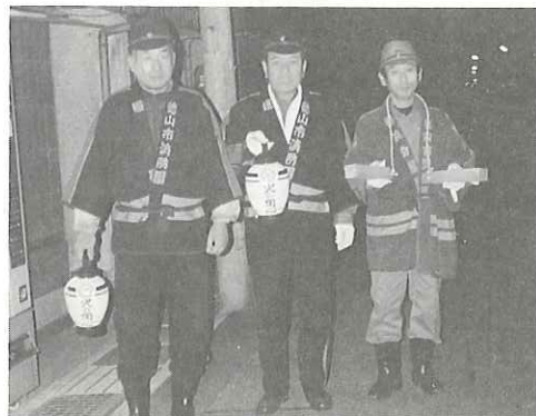
昔なつかし「カチカチ」火の用心