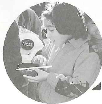
▲お母さん方心づくしのぜんざい