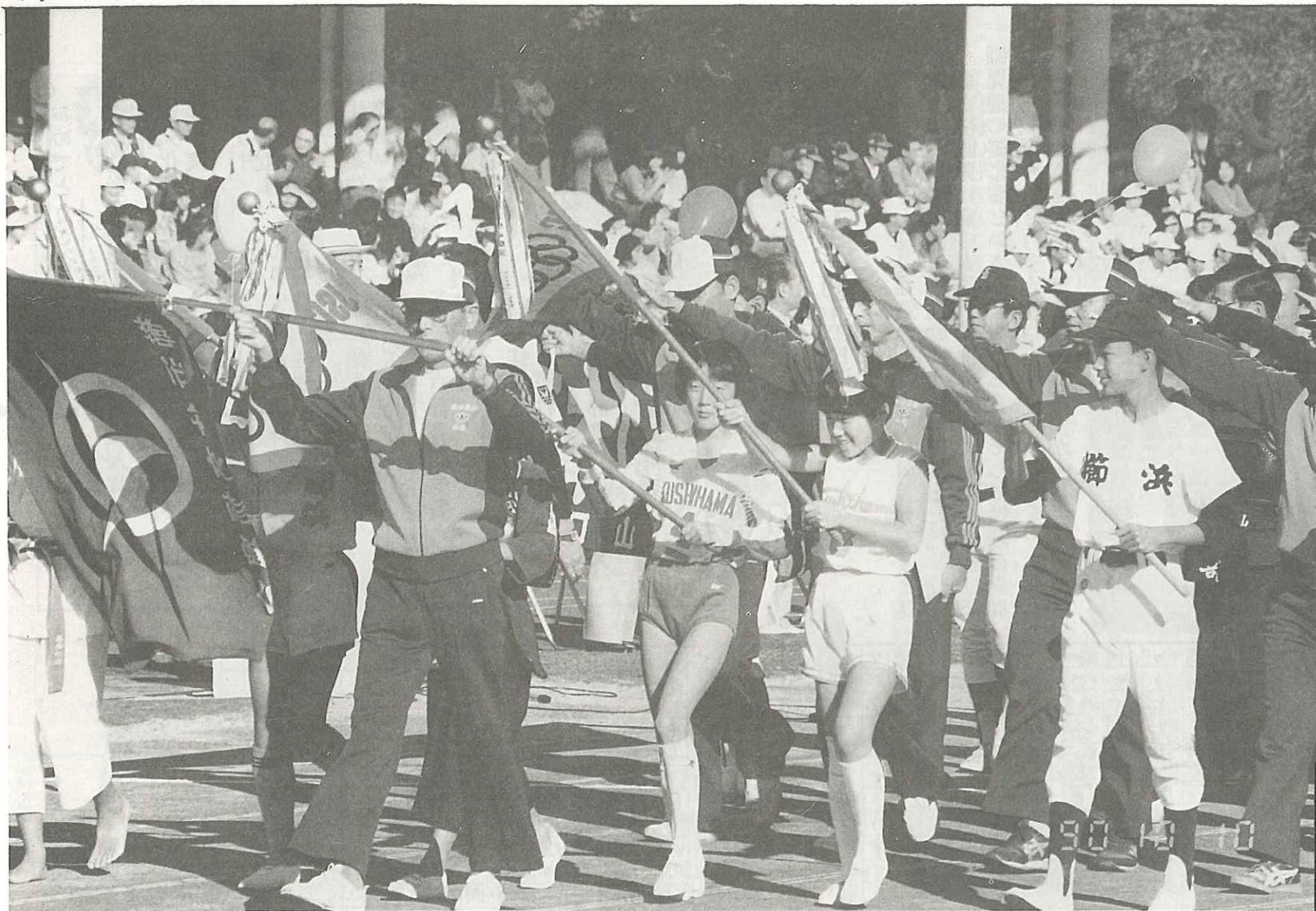
▲櫛浜チーム堂々の入場