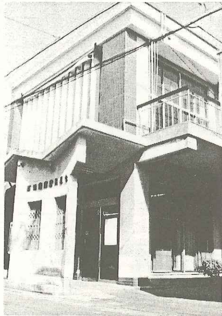
現在の櫛浜農業協同組合

尚昭和61年5月総会に於ける組合員数は正 448名、準 344名、団体1計 793名である。