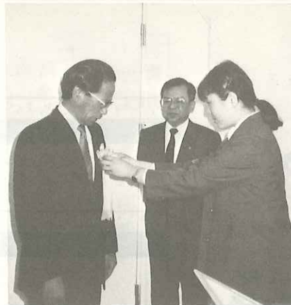
西村支所長が一日徳山榎浜郵便局長に。