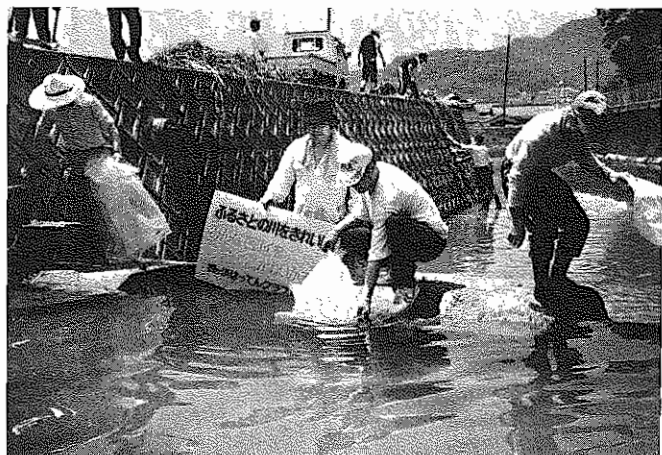
五月二十六日鍛冶屋川清掃と鯉の放流をする櫛ヶ浜はってんクラブ