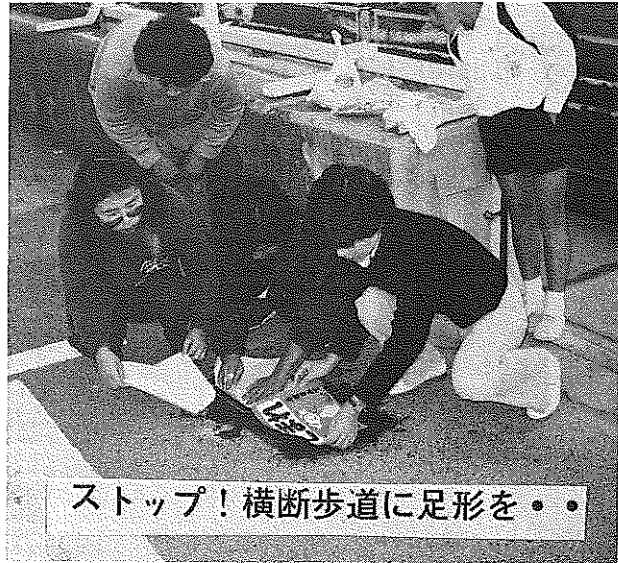
ストップ!横断歩道に足形を。