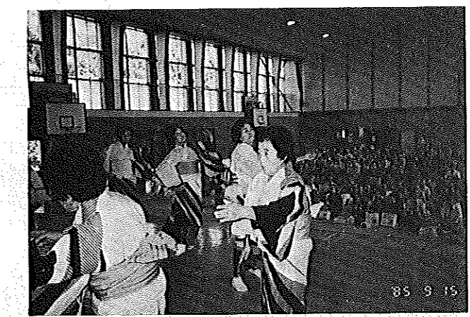
敬老会▲ いつまでもおげんきでネ!