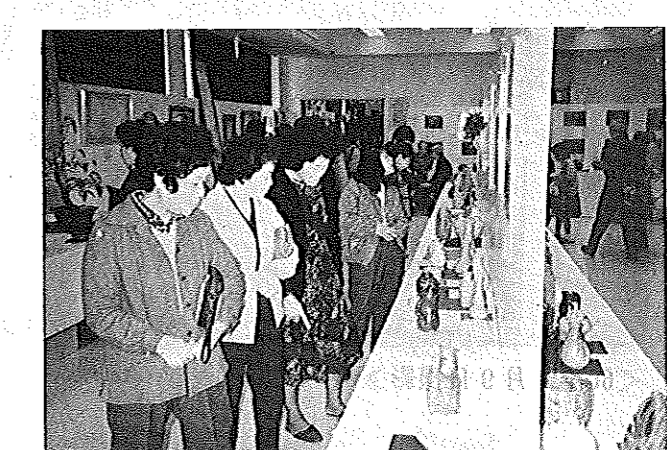
文化祭▲ 仲々の出来映えネー