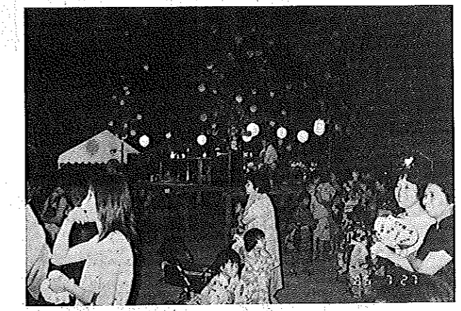
夏まつり▲ 踊る人も見る人も主役デス