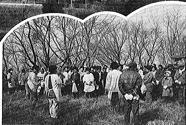
天神山清掃作業開始10分前

天神山公園 天神山「本松」といって昔から有名であった。大正九年この地を開き、桜の樹を植えて忠誠を建立し、遊憩場とした。久米唯一の観光地であり眼下に徳山、下松港があり、眺望絶佳である。またこの地が海拔八十八メートルの高さにあるので別名「八十八高地」とも言う。 (久米百年誌より)