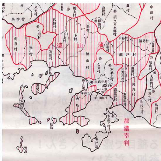
さいばん 宰判・村別地図 (部分) と久米神社

久米村は、田畑の面積も多く、米の収穫などは都濃宰判でもトップクラスですが、御蔵入（おくらいり）と言って直接、萩藩の米蔵に収められました。戸数452戸、2,006人、牛210頭、馬58頭です。なお、徳山藩領の議羽村は、家77戸、人口309人です。