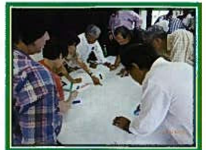
防災部長研修会(D I G訓練)の様子

また、1月11日のどんど焼き・三世代交流会にて資機材のお披露目を計画しています。自主防災の資機材を見ていただき、家庭での災害時の備えも見直されてはいかがでしょうか。