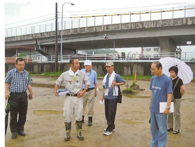
7月4日 垣外遺跡発掘現場(秋本地区)

今後も現場(物)の確認を重ねながら、最終的な目的である地域の子供たちに、久米が太古の頃から歴史に名を残した所であること、史跡を簡潔に説明した標識を作成し、その散策の地図を作ることに向けて、活動を続けていきます。今からでも結構です。学びのコミュニティ活動に是非ご参加下さい。(毎月1回開催しております。問い合わせ先：久米公民館 TEL 29-0451 まで)