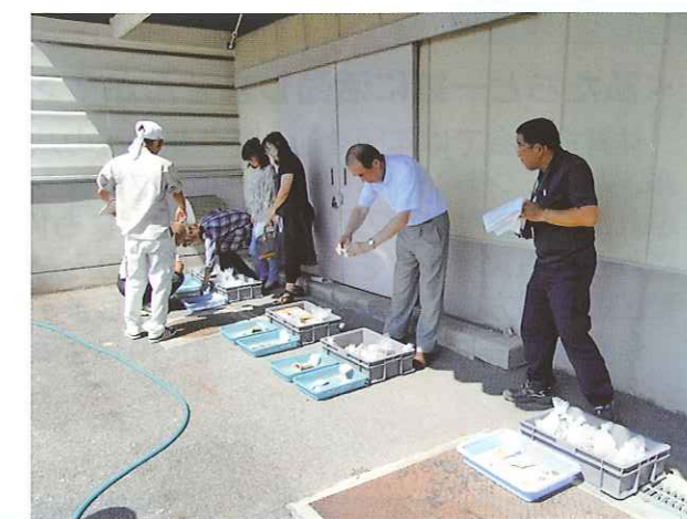
8月31日 周南市文化スポーツ課広場