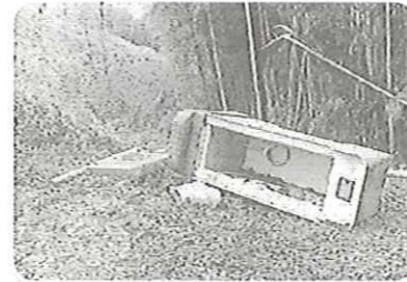
壊れた天神山トイレ

編集・発行 コミュニティ推進協議会 広報部 4月1日現在 久米の人口 男 4,333人 } 8,730人 女 4,397人 世帯数 3,758世帯