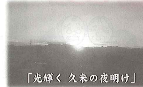
「光輝く久米の夜明け」