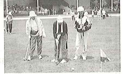
ベタンク・グランドゴルフ大会 5/28(金)