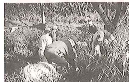
天神山一斉清掃 3/7(日)