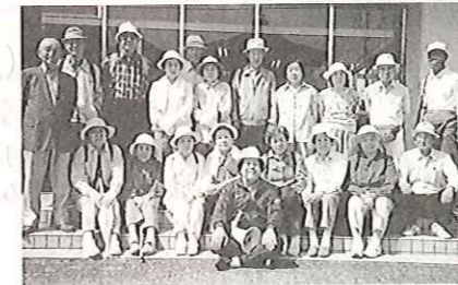
久米地区老人クラブ北寿会ハイキング 5/12(水) 周南緑地公園