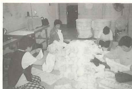
コミュニティ事務局 ボランティア活動

毎週火曜日。 鼓ヶ浦整肢学園において、コミュニティ事務局員4名が約2時間かけて700枚ものオムツをたたみます。