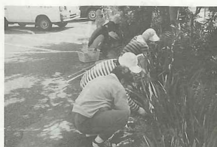
婦人会ボランティア活動

毎週火曜日。 鼓ヶ浦整肢学園において、コミュニティ事務局員4名が約2時間かけて700枚ものオムツをたたみます。