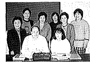
チーズの発音はもうすこしかな？

初級者コースは未だ受け入れの余裕があるとのこと。あなたも最初の第一歩を踏み出してみたいか