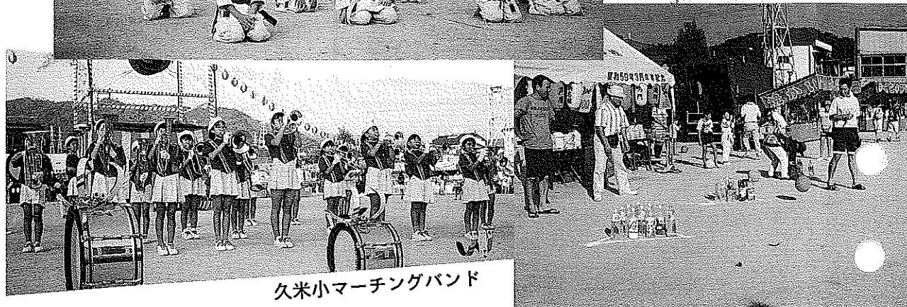
久米小マーチングバンド