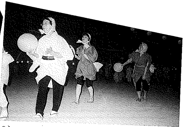
(3) どじょうはおらんかいの～