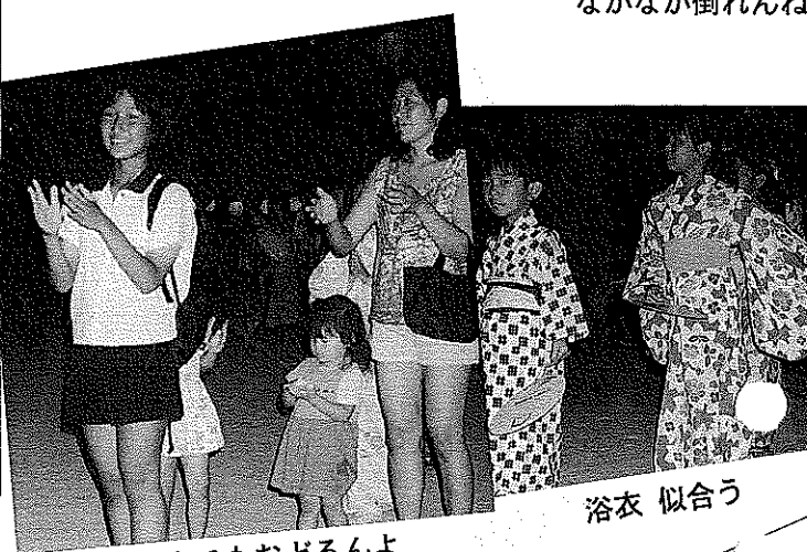
ワタチもおどるんよ