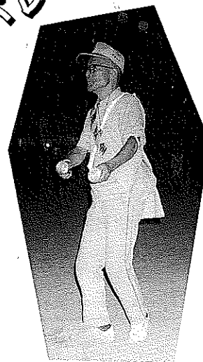
交通安全おじさん