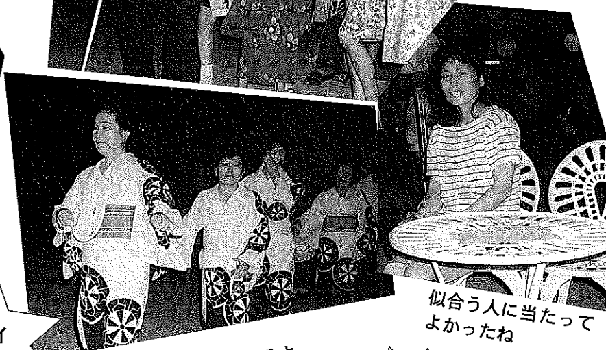
似合う人に当たってよかったね