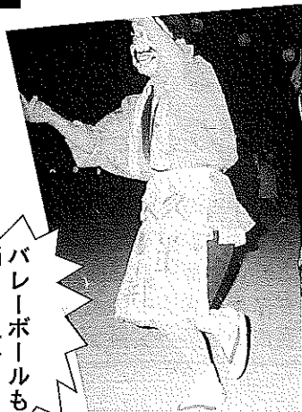
バレエボールも踊りも上手よ