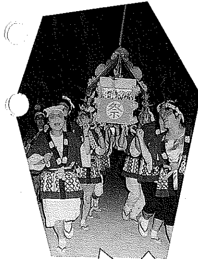
ワッショイワッショイ 婦人パワーを見せるわ