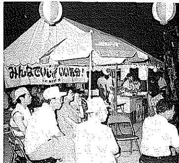
ビールもジュースも冷えちよるよ。