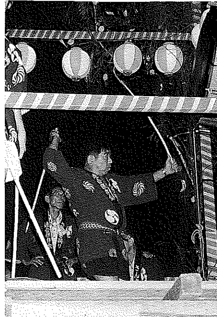
ヨ〜ォ ドドン (かっこええ〜)