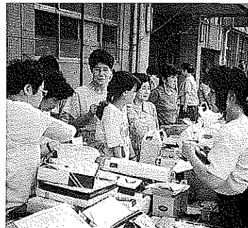
何かえもんあった?