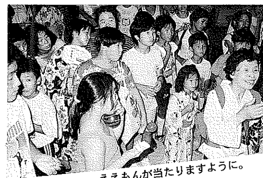
ええもんが当たりますように。