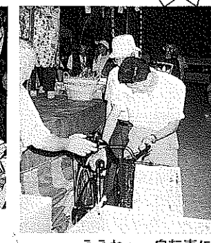
ええねえ〜自転車に乗って帰りんさいよ。