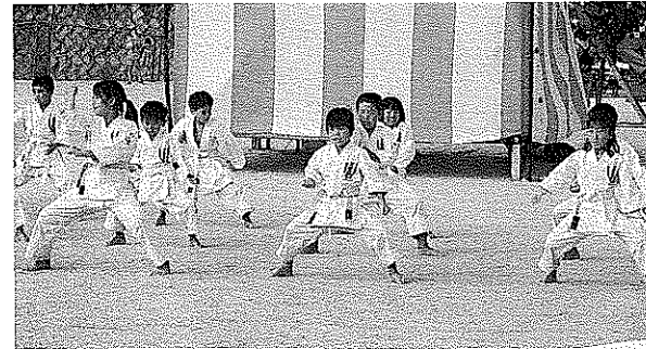
久米空手スポーツ少年団