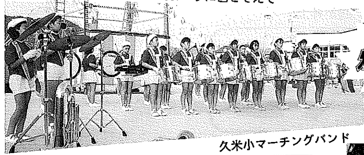
久米小マーチングバンド