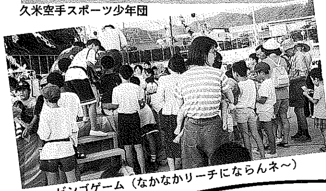
ビンゴゲーム (なかなかリーチにならんネ〜)