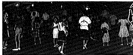
▲やっぱり冷たい氷がいいね