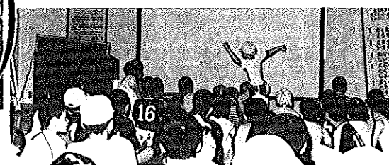
サテ、サテ何の映画かね▶

＜主催・主管＞コミュニティ推進協議会・体育振興会 ＜共 催＞自治会連合会・社会福祉協議会・婦人会・寿会・久米スポーツ広場運営協議会 ＜協 賛＞盆踊り保存会・三星・西久米・田中・久米市