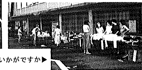
商売いかがですか▶