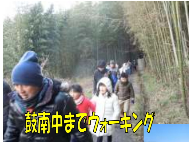
鼓南中までウォーキング