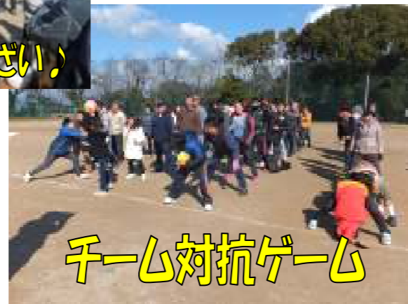
チーム対抗ゲーム

2月11日(土) 建国記念の日 ふれあい大会が行われました。寒波の影響で天候が危ぶまれましたが、当日は晴天となりました!