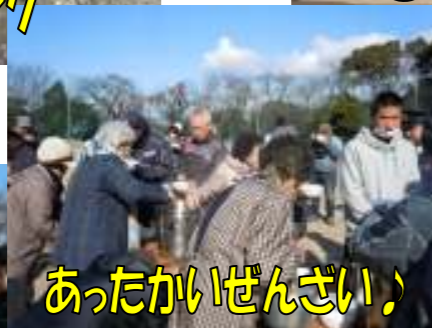
あったかいぜんざい!