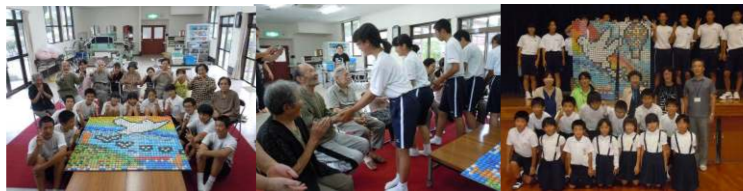
↑白鳩学園の皆さんと中学生