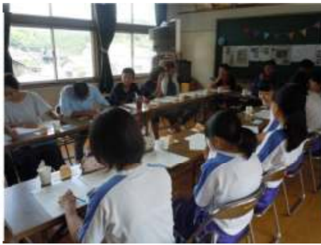
←杵南中学校の生徒も、 南河内の中学生と交流！