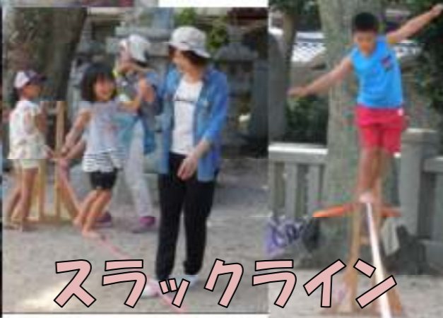
ロックバラシング