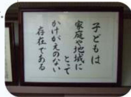
↑ 中学校の校長室に掲げてある額