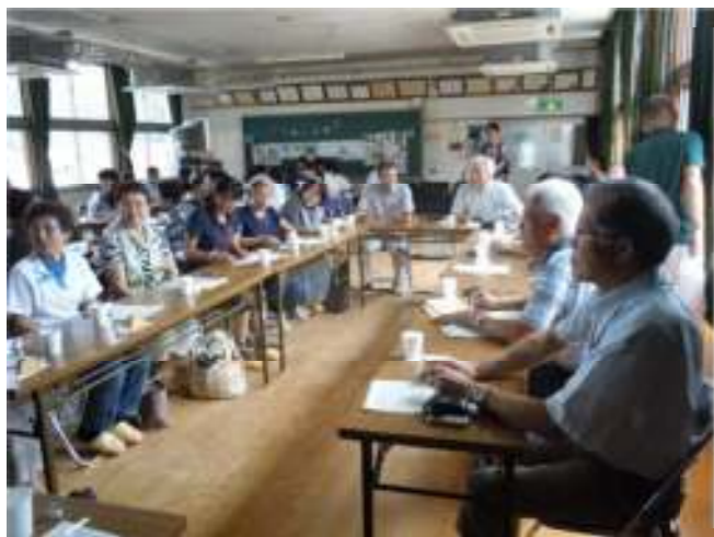
←民生委員・児童委員・福祉委員 同士で、互いの地域の現状について 情報交換。