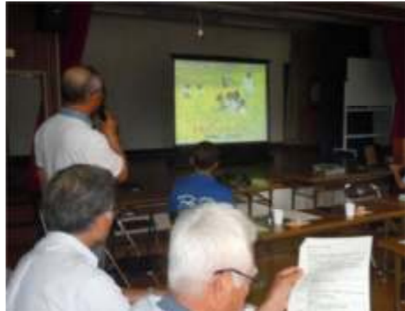
←スクリーンを使って、 南河内地区むらづくり塾の 活動を説明して頂きました。