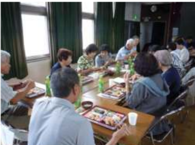
↑南河内の方々に作っていただいたお弁当♪ とてもおいしかったです！