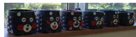
↑完成したのは「くまモン」のカゴ!