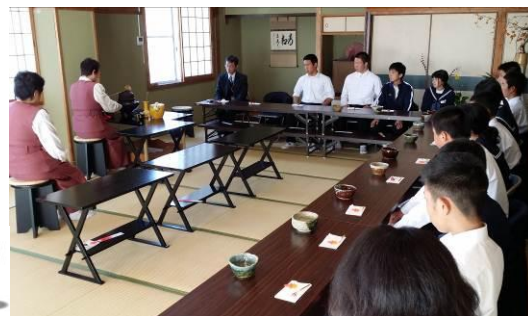
11/5 茶道教室。真剣な表情です。