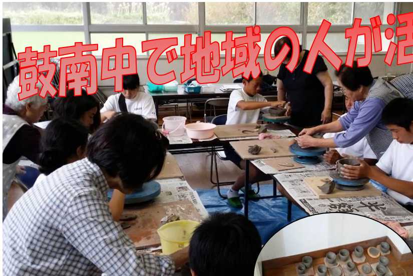
9/16 陶芸教室の皆さんと。 仕上がりが楽しみです▶