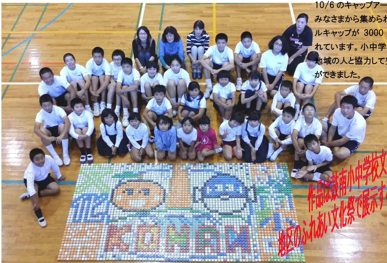
10/6 のキャップアートの様子。 みなさまから集められたペットボトルキャップが 3000 個以上使われています。小中学校・児童園・地域の人と協力して完成することができました。