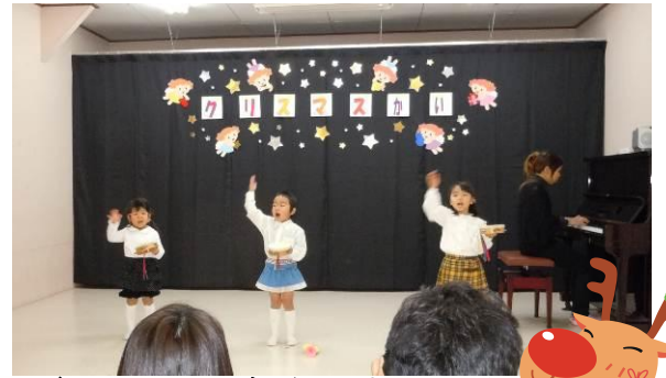
12/20 クリスマス会が行われました☆