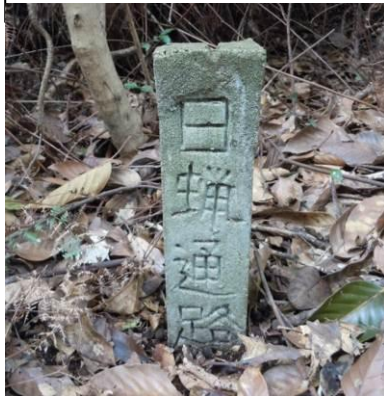
「日蠟通路と書いてあります。」

また、以前に紹介した作業所跡の近くに、海軍による標石(目印)だと言うものがありました。さらに戦時中の跡ではありませんが、砲台跡近くに「日蠟通路」と書かれた標石がありました。昔の山道の名残なのでしょうね。(続く)