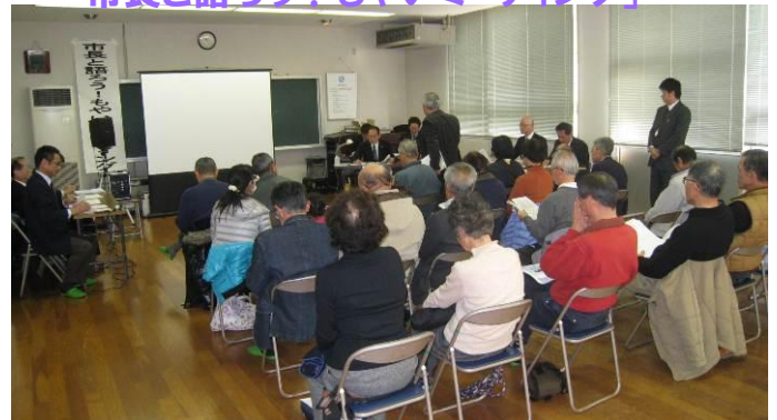
12/23、「市長と語ろう！もやいミーティング」が開催されました。参加者からはたくさんの意見が出され、今後の鼓南地区の発展に向けて有意義な会となりました。