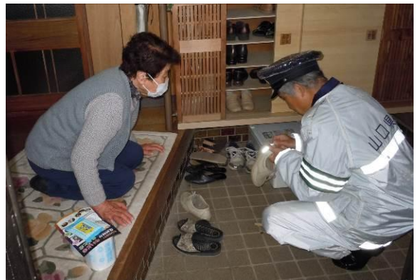
高齢者の方に夜間の外出時の注意を呼びかけました。写真は普段履く靴に反射板を貼っている様子です。