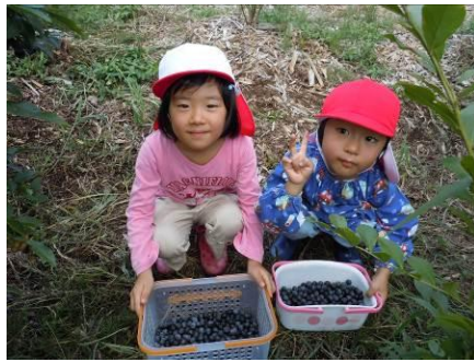
最後はみんなで記念撮影！

8/27、長穂児童園との交流会で、長穂でブルーベリー狩りをさせていただきました。たくさん獲れてよかったね☆