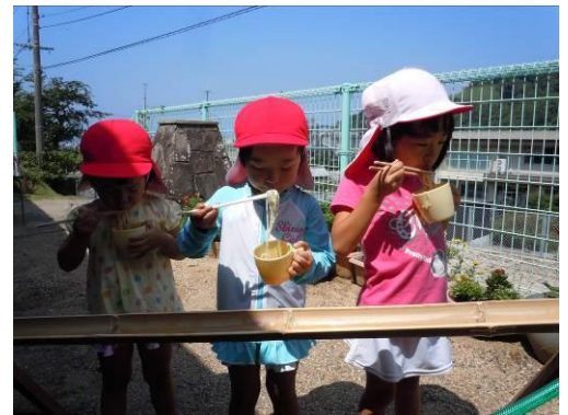
8/28、この日はそうめん流しをしました。いい思い出になったね♪