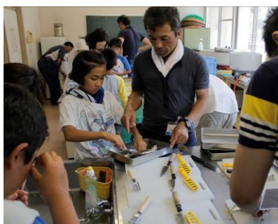
◀大島公民館の和室で釣った魚を調理している様子です★