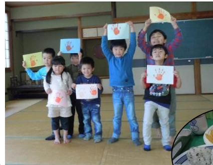
◀お別れ会で手形をとりました！おにぎりとおコバナもおいしかったね♪(3/8)