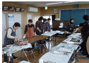
◀2/22 柿渋を使ってざる作り(粕島公民館)