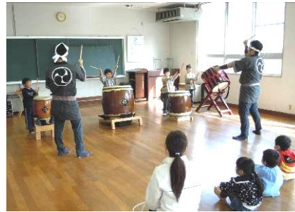
◀和太鼓の演奏会がありました。体験コーナーで太鼓を叩く子どもの姿がたまりません。(2/22)