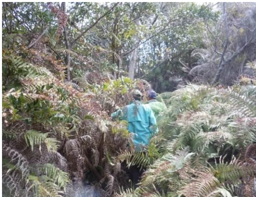
◀この先に機銃台跡があるはずでしたが…。

さらにその先には『作業場』跡の石垣があり、さらにその先の『13ミリ機銃台』を探しにいきましたが、背の高さほどの大やぶに囲まれて発見できませんでした。(続く)