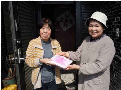
◀2/26 お一人で暮らしている高齢者のかたに弁当を配りました。