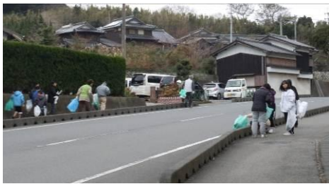
12月23日、 つづみ会連絡協議会 主催で鼓南クリーン アップ作戦が行われ ました。

これは、「きれいな街＝犯罪のない街」を子どもたちとふれあいながら進めていくものです。この活動を通して、大人と子供が交流するいい機会となりました。