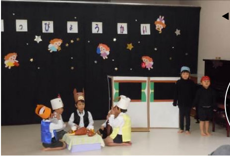
◀12/19 発表会 の様子