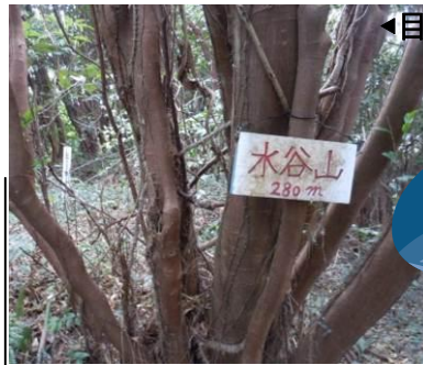
◀目印の水谷山 280mの札です

道沿いにあるので歩けば簡単に目に入りますが、そんな意味のある穴だとは思いませんでした。ちなみに、その砲台が実際に使われることはほとんど無かったようです。(続く)