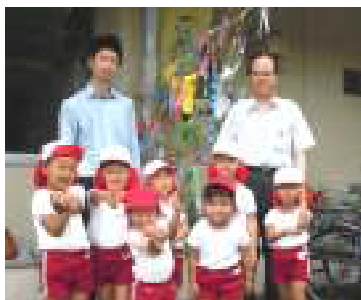
◀大島公民館に七夕かざりをプレゼント☆