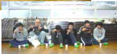
(大島公民館の様子です)

毎年、建国記念の日（2月11日）に開催されている鼓南地区コミュニティ推進協議会の主催行事ですが、今年は雨と強風のため、やむなく鼓南中学校へのウォーキングは中止となり、大島公民館と杵島公民館に分かれての室内開催となりました。