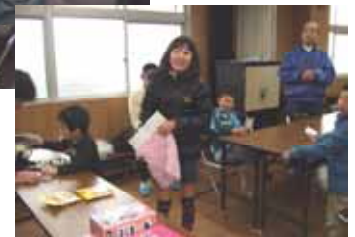
(杵島公民館の様子です)