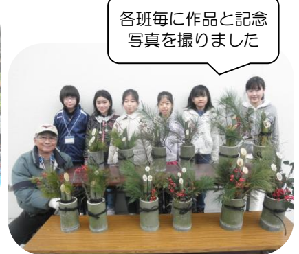
各班毎に作品と記念写真を撮りました