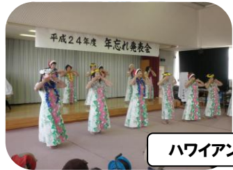
ハワイアン・フラ岐山