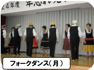
フォークダンス(月)

12/16(日) 恒例の年忘れ発表会を河原幼稚園の講堂をお借りして開催いたしました。今回は新たに「琴」の皆さんに出演いただき、計9講座の皆さんが日頃の練習の成果を遺憾なく発表されました。 老人クラブ連合会から老人クラブのメンバーを、社会福祉協議会からは独居のお年寄りの方を毎回お招きしていますが、今回は約100名の方々においていただき、出演の皆さんのステージ発表を楽しんでいただきました。 出演されました講座生の皆さん、指導いただきました講師の皆様はじめ、来賓の皆さん、お世話いただきました社協、老連、民児協、ボランティアの皆さんのお陰で無事開催することができました。 ありがとうございました。