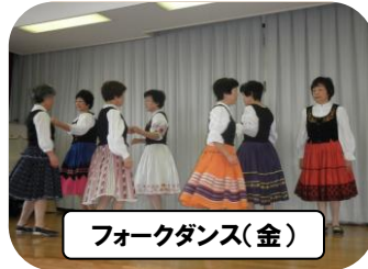
フォークダンス(金)