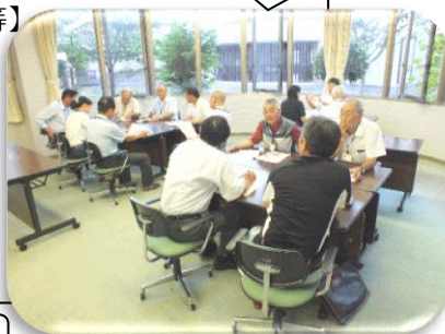
部会別の真剣な協議の様子です

八月一日に第二回学校運営協議会がありました。参加委員は十五名。学校評価アンケート結果や児童の様子について協議を行うとともに、部会別に一学期の各部の活動の反省と二学期以降の活動について協議しました。