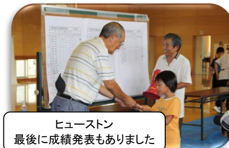
ヒューстон 最後に成績発表もありました