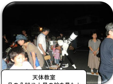
天体教室 月の凸凹や土星の輪を見たよ