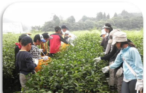
お茶摘み お年寄りに教わりお茶を摘みました！