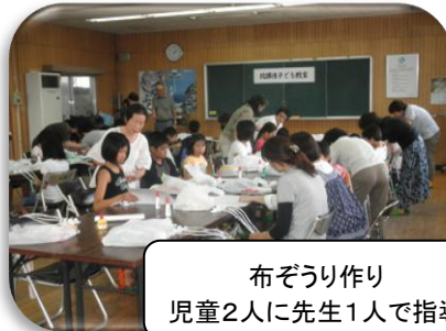
布ぞうり作り 児童2人に先生1人で指導