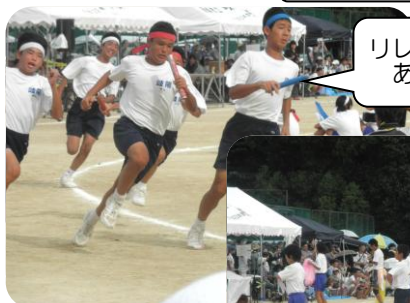
リレーは迫力があります！