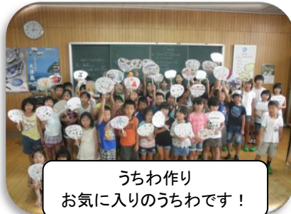
うちわ作り お気に入りのうちわです！