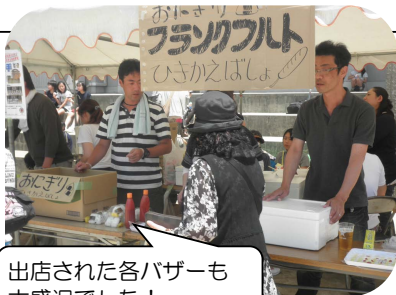
出店された各バザーも大盛況でした！