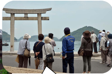
これは大崎下島の御手洗湾の写真です。

6/7 クラブの会員39名で下浦刈島方面へ研修旅行に出かけました。この周りの島は呉から殆どの島が橋で結ばれ、訪れやすくなりました。また、大河ドラマ「平清盛」のロケもこの界隈で行われました。史跡探訪クラブでは年に数回、研修を企画しております。みなさんも気軽に参加してみませんか？