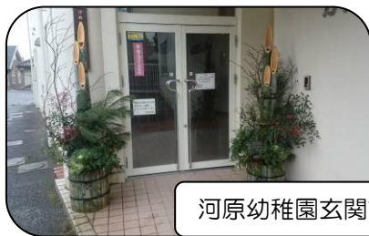
河原幼稚園玄関前