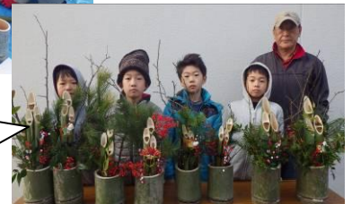
全員が完成させ、グループ毎に記念撮影しました。