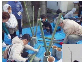
中に立てる3本の竹を斜めに切る作業に苦戦！

12/26（土）自然体験教室の一環で「ミニ門松作り」を行いました。今回は岐山小児童18名と「きさんの寺子屋」の参加者15名、計40名が合同で作業しました。参加した児童はもとより大人も中に立てる3本の竹を斜めに切ることが難しく苦勞していましたが、飾りつけはそれぞれの思いで行い、オリジナルなミニ門松ができました。指導していただきました地域のボランティア5名の皆さん、ありがとうございました。