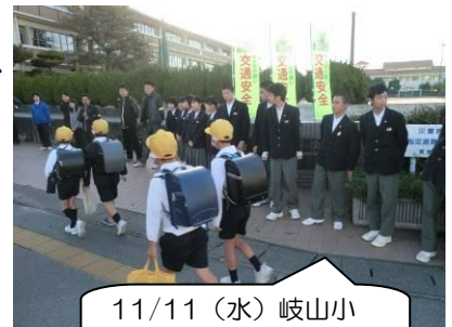
11/11(水) 岐山小 正門前の風景です