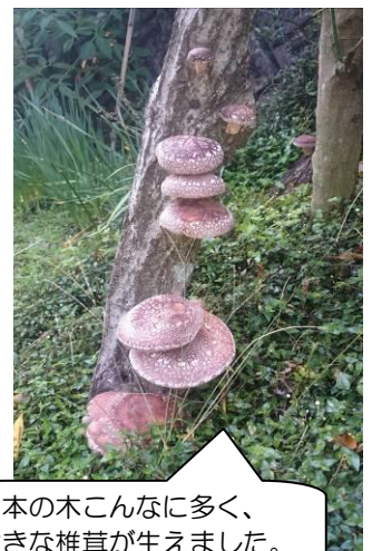
1本の木こんなに多く、 大きな椎茸が生えました。

今年の春には、早くも生えたという方がおられました。この秋には「生えたよ!」という声を耳にすることが日を追う毎に多くなりました。原木を買った皆さん、どうですか? 鍋の美味くなったこの時期、自宅で採れた椎茸の味は格別ではないでしょうか?