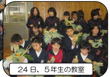
24 日、5 年生の教室