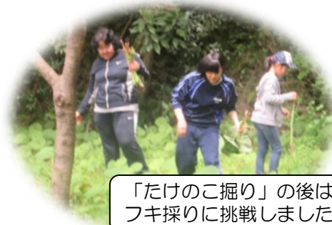
「たけのこ掘り」の後は フキ採りに挑戦しました