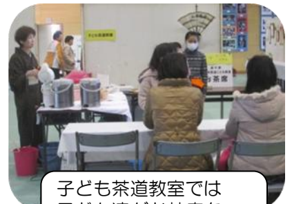
子ども茶道教室では子ども達がお茶席を盛り上げていました。