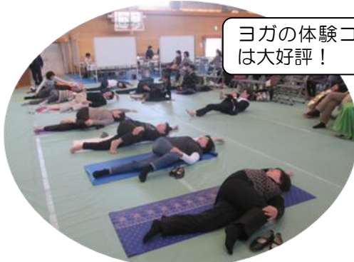
ヨガの体験コーナーは大好評！