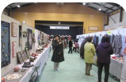
通路の両サイドに洋裁、パッチワークの作品を展示