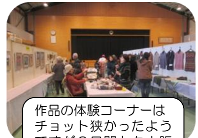
作品の体験コーナーはチョット狭かったようですが2日間とも大賑わいでした。