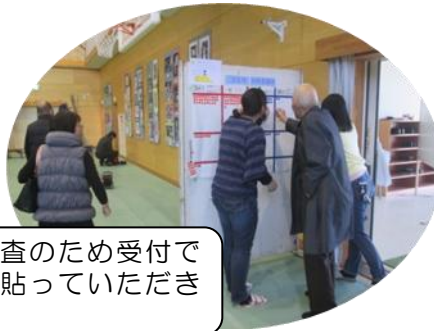
来場者調査のため受付でシールを貼っていただきました