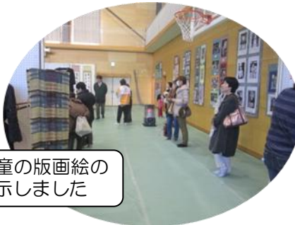
壁面には児童の版画絵の入選作を掲示しました