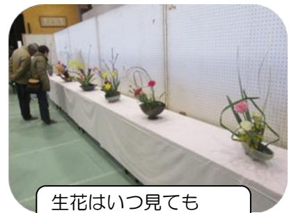
生花はいつ見ても気持ちが落ち着きます。