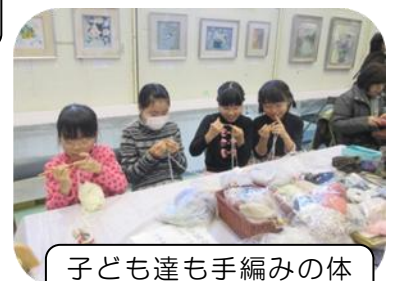
子ども達も手編みの体験にチャレンジ！