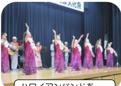
ハワイアンバンドをバックにフラを披露