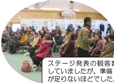
ステージ発表の観客数を心配していましたが、準備したイスが足りないほどでした。