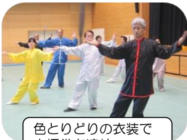
色とりどりの衣装で太極拳を演技