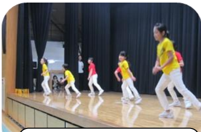
ジャズダンスは子ども達も応援に駆け付け、可愛いダンスを踊りました。