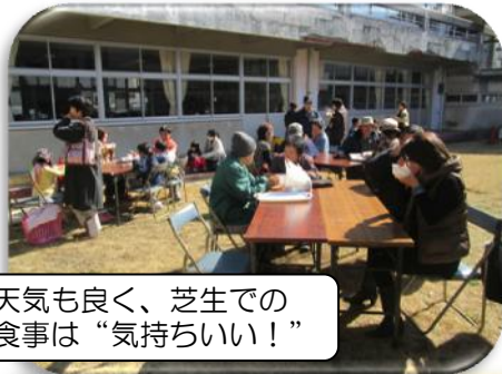
天気も良く、芝生での食事は“気持ちいい！”