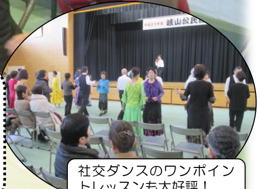
社交ダンスのワンポイントレッスンも大好評！

2/22 (土)・23 (日) の2日間、岐山小の体育館をお借りして、公民館文化祭を開催しました。今回は新たな試みでステージ発表と作品展示を一緒に行い、また体験コーナー等も取り入れた“参加型”のテーマで開催しました。2日間とも天候にも恵まれ、約1,000人の皆さんに会場にいただきました。来場された皆さんは作品の出来栄え、ステージでの発表、講座体験への参加などで新たな発見や感動で楽しんでいただけたのではないのでしょうか？ 3ページにも文化祭特集を掲載しています。