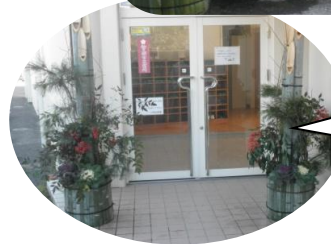
河原幼稚園の玄関前