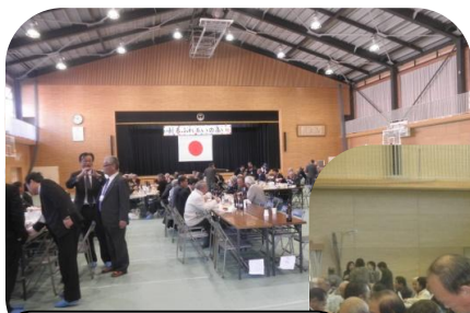
新春ふれあいの集い (コミュニティ・自治会連合会)