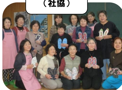
布ぞうり作り (社協)

11/29(月) 社協のメンバーが主体となり、地区のみなさんに布ぞうり作りの講習を行われました。