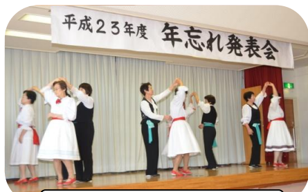
フォークダンス月曜教室

14名のメンバーの皆さんが昨年に引き続き「年忘れ発表会」のトップバッターで登場していただきました。舞台も会場も緊張している中で、3曲をリズムに合わせて日頃の練習どおり気持ちよく踊られました。