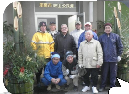
製作したメンバーと公民館前の門松